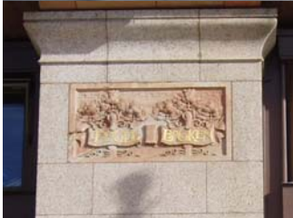
Centralpalatset vid Tegelbacken i Stockholm 1896.

Ernst Stenhammar har skrivit in sig i svensk arkitekturhistoria också för att han introducerade skelett-konstruktionen från skyskrapbyggandet i USA. Centralpalatset vid Tegelbacken i Stockholm uppfört 1896 är den första byggnaden i landet med denna stomme. Fasaden är indelad vertikalt i kraftiga pelare med fönsterytor emellan. Man anar Jugend-stil i dekorationerna. Ett annat välkänt hus av Stenhammar med samma konstruktion är Myrstedts hörna vid Kungsgatan i Stockholm från 1909.