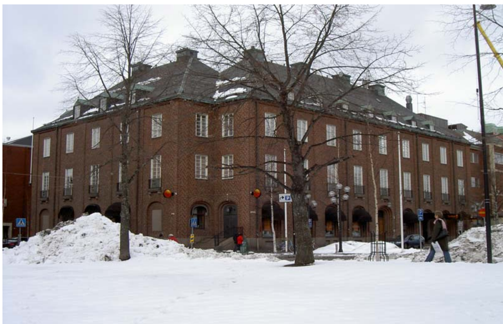
Sparbankshuset sett från Rådhusparken.