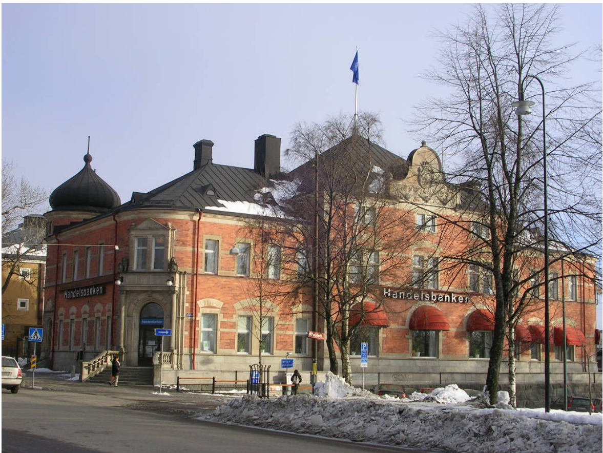
Handelsbanken vid Rådhusparken i Umeå.

Stenhammar kom från en väletablerad arkitektfamilj med musikaliska intressen – Wilhelm var hans bror. Han fick arkitektutbildning i Stockholm, kompletterad med den obligatoriska studieresan till den ”stora” arkitekturen ute i Europa. IG Clason, var hans lärofader, en arkitekt som präglade en hel generation vid slutet av 1800-talet med sina idéer om äkthet i byggnadsmaterial och planering. Putsade fasader ansågs falska, de imiterade ju bara sten.