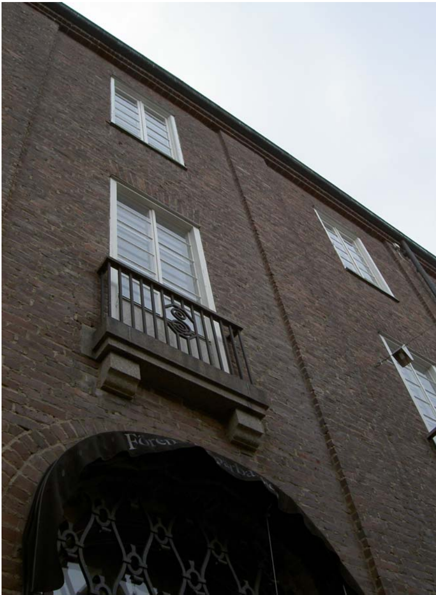
Sparbanken i Umeå. Utsnitt av västra fasaden.

Torben Grut arbetade hårt. Han var, såväl på som utanför arenorna, en tävlingsmänniska ut i fingerspetsarna och en dålig förlorare. De sista åren förmörkades av vistelse på mentalsjukhus, varefter han flyttade till sina föräldrars hemland Danmark, där han avled 74 år gammal.